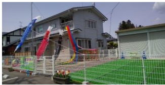
よつば保育園 2020.5 開園